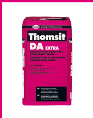
Veľkosť balenia (p.j.): 25 kg p.j. / paleta: 42 x 25 kg