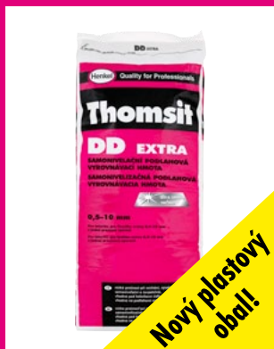
Veľkosť balenia (p.j.): 25 kg p.j. / paleta: 42 x 25 kg