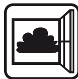
Dbať na primerané vetranie