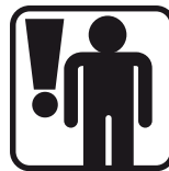
Dbáť o bezpečnosť osôb